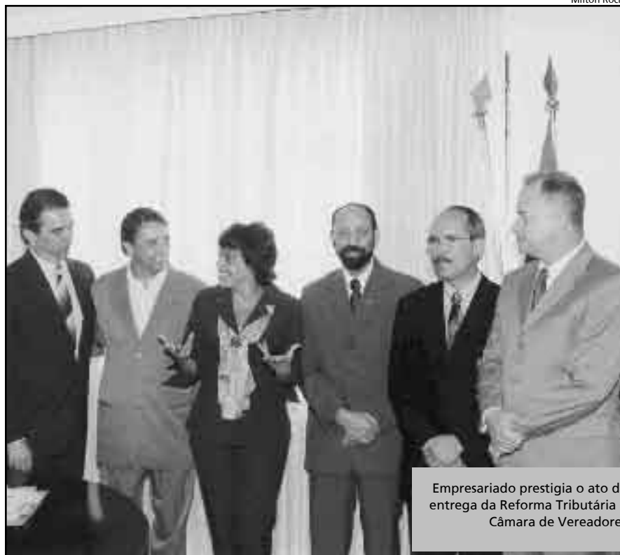
Empresariado prestigia o ato de entrega da Reforma Tributária à Câmara de Vereadores