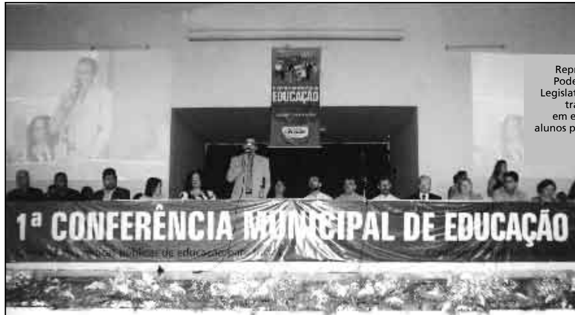
Representantes dos Poderes Executivo e Legislativo Municipais, trabalhadores(as) em educação, pais e alunos participaram do evento

Segundo o secretário, algumas questões, como os ciclos de formação humana e a valorização dos trabalhadores, que demandam mais tempo para discussão, foram encaminhadas para fóruns, criados durante a conferência, e para a Comissão Permanente de Negociação. Também foi criado um fórum permanente deliberativo para a Educação Infantil e para a proposta dos