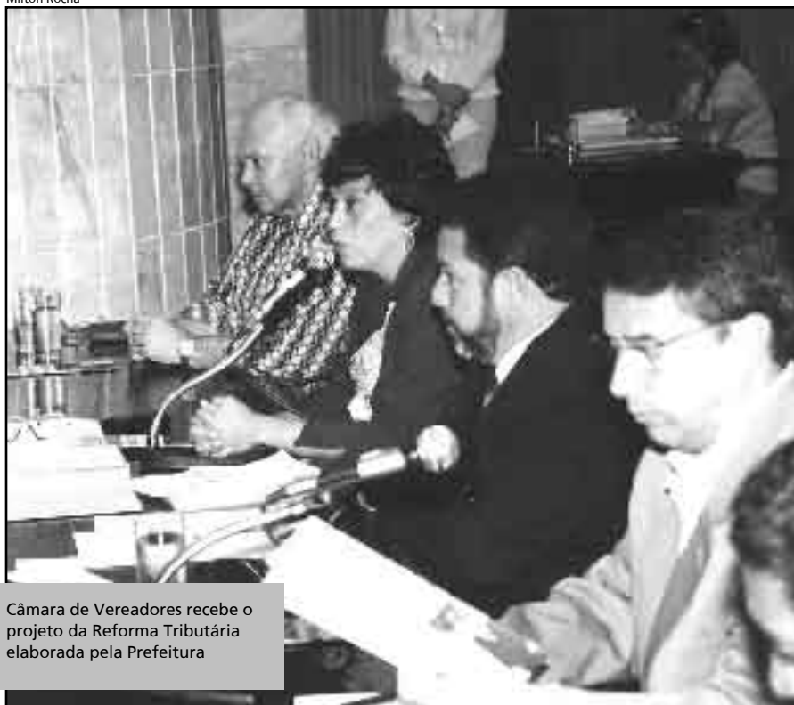
Câmara de Vereadores recebe o projeto da Reforma Tributária elaborada pela Prefeitura