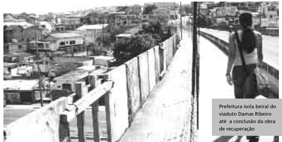
Prefeitura isola beiral do viaduto Damas Ribeiro até a conclusão da obra de recuperação

placas de advertência, até a construção do novo beiral. Também foi feita uma limpeza do local, visando desobstruir o sistema de drenagem, principalmente, durante o período de chuvas.