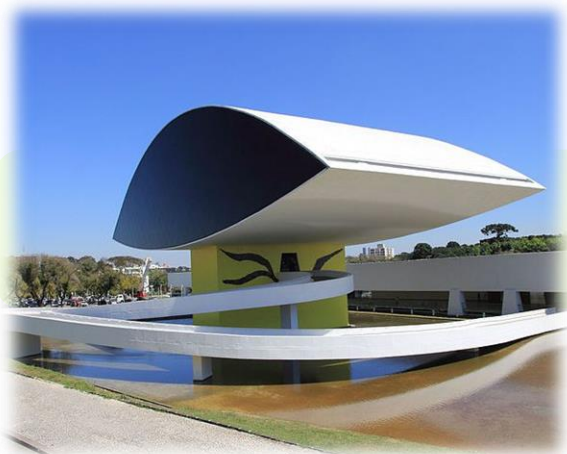
Museu Oscar Niemeyer – Curitiba (PR)