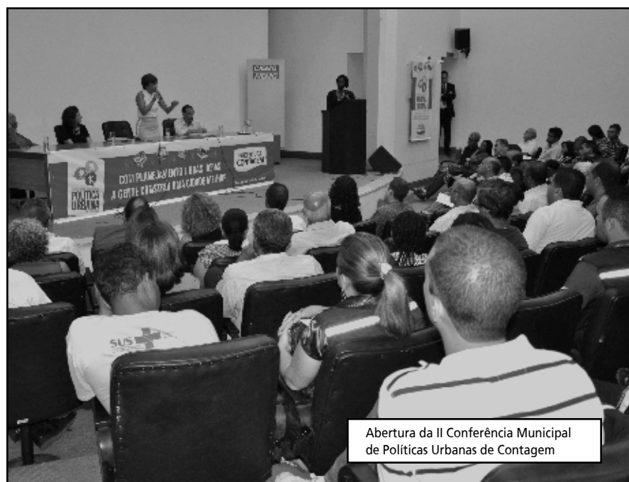
Abertura da II Conferência Municipal de Políticas Urbanas de Contagem

O professor apresentou em linhas gerais o que se pretende para o futu-