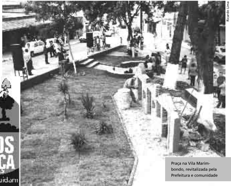
Praça na Vila Marimbondo, revitalizada pela Prefeitura e comunidade

Urbano e Meio Ambiente, pelo telefone 3395-7913, ou na avenida João César de Oliveira, 1410, Eldorado.