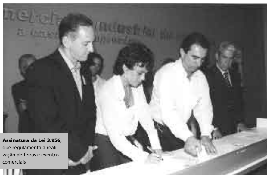
Assinatura da Lei 3.956, que regulamenta a realização de feiras e eventos comerciais

A nova legislação determina a criação da Comissão Municipal