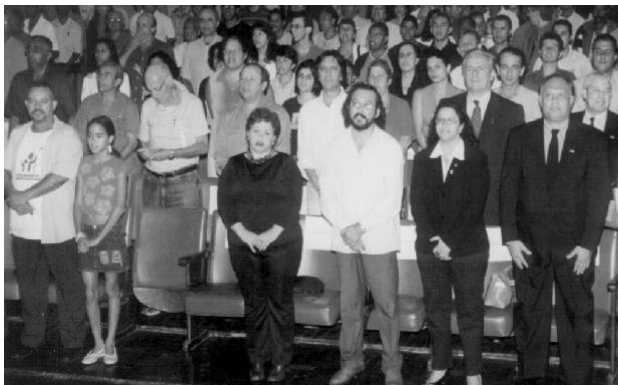
Cerca de 700 pessoas participaram do lançamento do OP

O Orçamento Participativo (OP) de Contagem foi lançado no dia 11 de maio, no Cine Teatro de Contagem, com a presença de aproximadamente 700 pessoas. Depois de 15 anos, o OP sai do papel, é regulamentado pelo Decreto 65 de 2005 e se transforma em realidade. Ele garante o exercício da cidadania e a participação popular na definição das prioridades da Administração Municipal e possibilita o controle social na implementação das ações prioritárias.