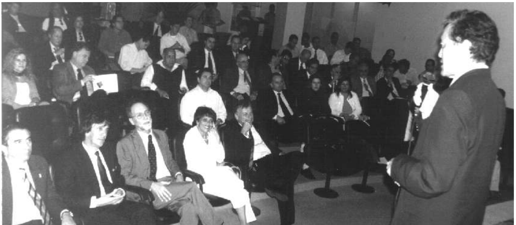
Palestra sobre o pólo acrílico no Centro Industrial e Empresarial de Minas Gerais (Ciemg)

O primeiro passo para a atração de novos investimentos e geração de 5 mil empregos em Contagem e cidades vizinhas, a partir da instalação do pólo petroquímico em Ibitiré, na região metropolitana de Belo Horizonte, já foi dado.